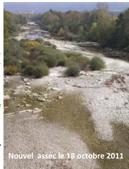
Nouvel assec le 18 octobre 2011

Le conseil municipal demande que la communication se fasse toute l'année et pas seulement de mars à octobre.